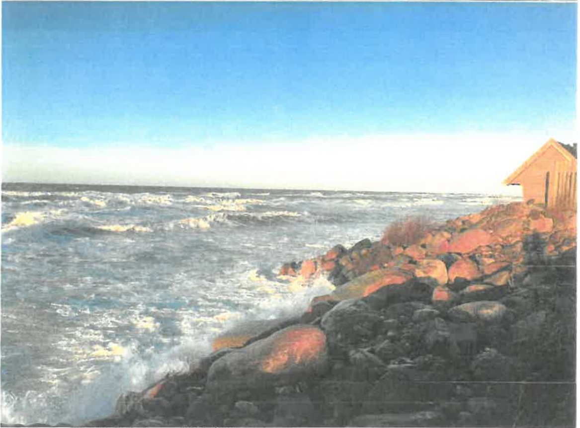
Februar 2022 (Højvande i forbindelse med Malik stormen)