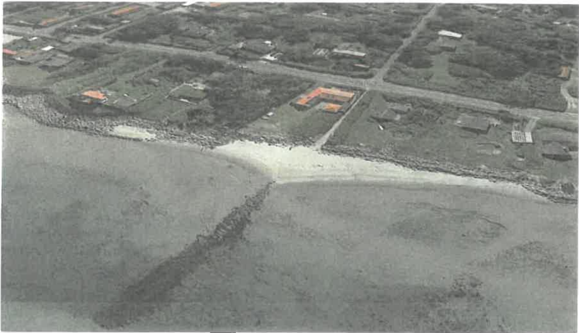
Google Earth, oktober 2020