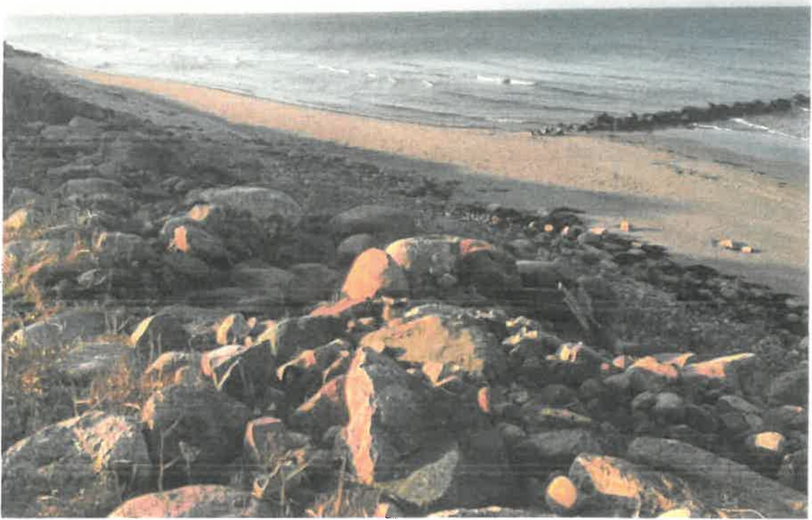
Februar 2022 (Stranden efter Malik stormen)